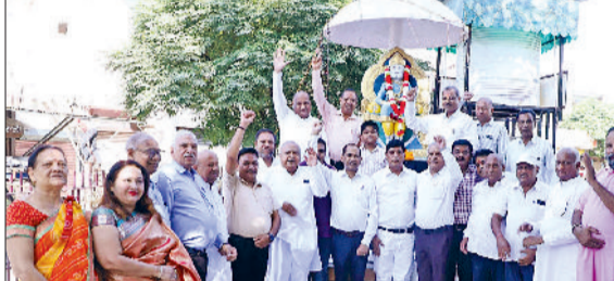
फतेहाबाद। महाराजा अग्रसेन प्रतिमा पर माल्यार्पण करते समाज के लोग।