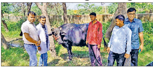
भटुकलां। पशुओं का उपचार करते चिकित्सक।