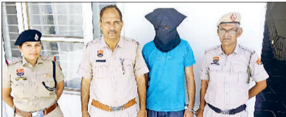
फतेहाबाद। पुलिस गिरफ्त में महिला से छीना झपटी का आरोपी।

भट्ट रोड पर महिला से छीने थे सोने के गहने हरिभूमि न्यूज ► फतेहाबाद