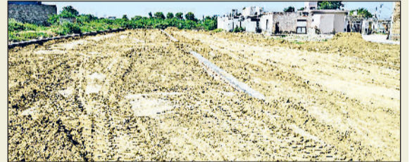
भूना। कुलां रोड पर नियमों को ताक पर रखकर काटी गई कॉलोनी में किया जा रहा निर्माण।

भूना। कुलां रोड पर नियमों को ताक पर रखकर कॉलोनीबाइजर्स द्वारा अवैध कॉलोनी का धड़ल्ले से विकास किया जा रहा है। बिना किसी अनुमति के बड़ी संख्या में झुग्गी, शोम्न और रिहायशी प्लॉट काटकर लाखों रुपये में बेचे जा रहे हैं। हैजनों की बात यह है कि जिला नगर योजनाकार विभाग इस पूरे मामले में चुप्पी साधे हुए है। विभागीय अधिकारियों की खामोशी ने कई सवाल खड़े कर दिए हैं। यह कॉलोनी पूरी तरह से गैर-कानूनी है। न तो इसका कोई लेआउट पास हुआ है, न ही आवश्यक सुविधाओं जैसे सौरभोजन, पानी, सड़क और पार्क आदि की कोई योजना है। विभाग की चुप्पी से लोग हैरान हैं।