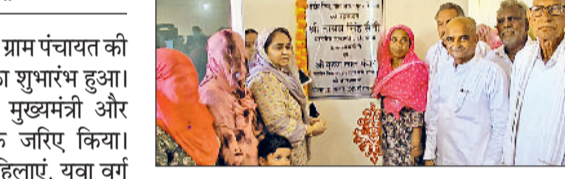
नशा समाज की सबसे बड़ी चुनौती

इस जिम के माध्यम से युवा वर्ग नशे जैसी बुराईयों से दूर रहकर अपने स्वास्थ्य की ओर जागरूक होंगे। सरपंच ने कहा कि नशा आज समाज के लिए सबसे बड़ी चुनौती है। युवाओं को सही दिशा देने और उन्हें खेलों से जोड़ने के लिए यह जिम खुलवाया गया है। उन्होंने कहा हमारा उद्देश्य है कि युवा नशे को अलविदा कहें और फिटनेस को अपनाएं। उन्होंने हरियाणा सरकार का आभार जताते हुए कहा कि ऐसी जिम हर गांव में खोली जानी चाहिए ताकि ग्रामीण स्तर पर भी फिटनेस कल्चर को बढ़ावा मिल सके। गांव के युवाओं में इंडोर जिम को लेकर खासा उत्साह देखने को मिला।