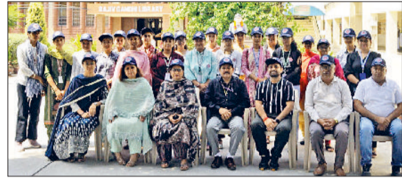
फतेहाबाद। एमएम कॉलेज में सेवा पखवाड़े के अंतर्गत आयोजित कार्यक्रम में भाग लेते स्टाफ सदस्य व विद्यार्थी।