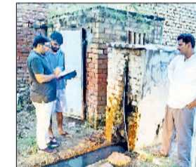
फतेहाबाद। गांव भिरड़ाना में अवैध पानी कनेक्शन काटते कर्मचारी।

गांव भिरड़ाना में कार्रवाई, 19 लोगों को थमाया नोटिस हरिभूमि न्यूज ► फतेहाबाद