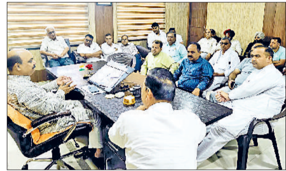
फतेहाबाद। बीजेपी जिलाध्यक्ष से बातचीत करते व्यापारी।