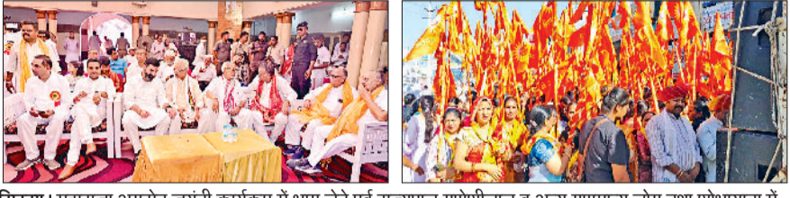
सिरसा। महाराजा अग्रसेन जयंती कार्यक्रम में भाग लेते पूर्व राज्यपाल गणेशीलाल व अन्य गणमान्य लोग तथा शोभायात्रा में शामिल अग्र बंधु।